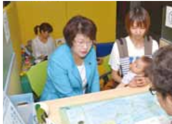
保育コーディネーター視察／2013年7月

(仮称)子どもセンターがオープン。ここで、保育施設の申し込みなどの手続きを含む子育て支援サービスの利用相談、情報提供を行います。