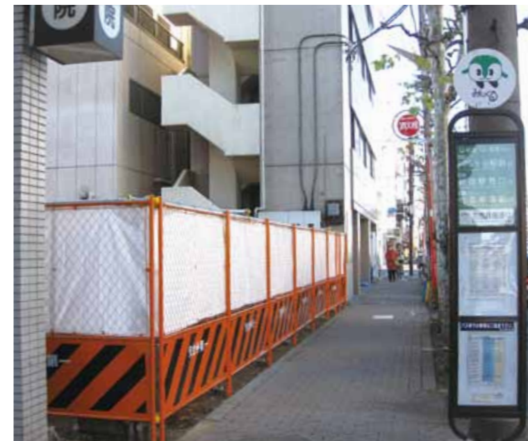
バリアフリー化のために取得された用地(和泉4-51-13)

「地下鉄方南町駅のバリアフリー化を願う会」が、平成19年3月に1838人の署名簿と共に東京地下鉄株式会社(東京メトロ)に要望していましたが、平成22年11月5日、多くの皆さまの協力が実り、用地を取得することができました。