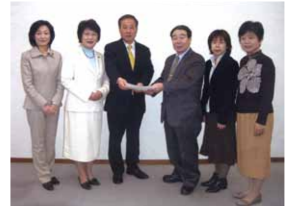
東京地下鉄株式会社の担当者へ要望書を提出

「地下鉄方南町駅のバリアフリー化を願う会」が、平成19年3月に1838人の署名簿と共に東京地下鉄株式会社(東京メトロ)に要望していましたが、平成22年11月5日、多くの皆さまの協力が実り、用地を取得することができました。